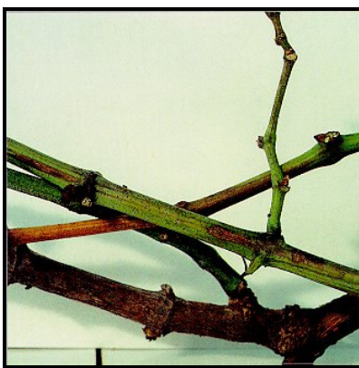
Tipiche pustole nere sui tralci