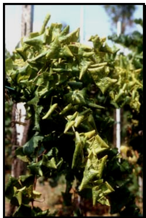
Sintomi sulle foglie in varietà a bacca bianca