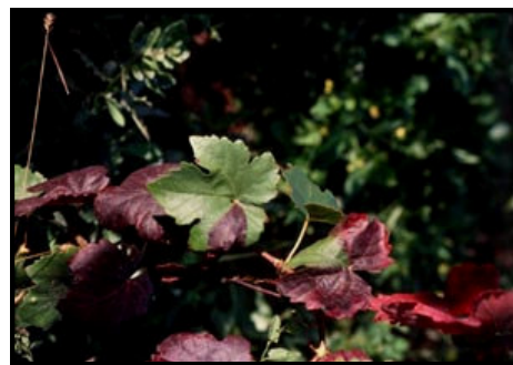
... e a bacca rossa